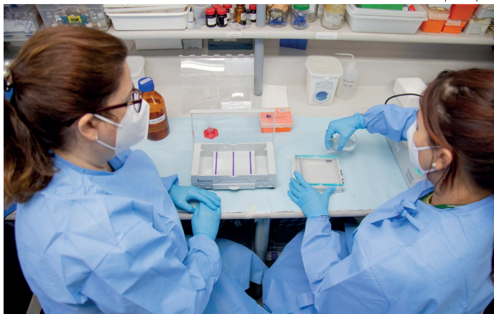
Os dois editais são o inédito Programa de Apoio à Liderança Feminina na Inovação e Sustentabilidade da Amazônia – Lidera Cientista-AM, e a reedição do Programa Amazônidas – Mulheres e Meninas na Ciência 2026, exclusivo para o interior do estado

O Programa de Apoio à Liderança Feminina na Inovação e Sustentabilidade da Amazônia (Lidera Cientista/AM), tem como objetivo fomentar projetos de pesquisa, desenvolvimento e inovação para criação de produtos, serviços ou processos inovadores, conduzidos por pesquisadoras com título de doutorado, com atuação vinculada a instituições de pesquisa e/ou ensino superior, centros de pesquisa, empresas ou órgãos públicos ou privados sem fins lucrativos, sediados no Amazonas, promovendo a inclusão e o protagonismo feminino na ciência, tecnologia, inovação e empreendedorismo sustentável.