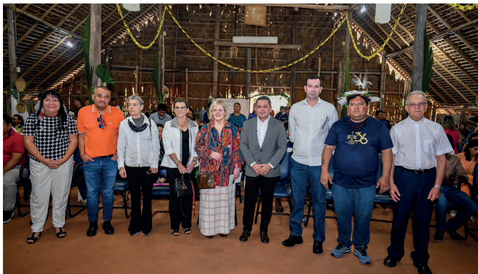
As línguas oficiais do Amazonas passam a ser: Apurinã, Baniwa, Dessana, Kanamari, Marubo, Matis, Matses, Mawe, Mura, Nheengatu, Tariana, Tikuna, Tukano, Waiwai, Waimiri e Yanomami

Aprovada pela Assembleia Legislativa do Amazonas (Aleam) no dia 12 de julho deste ano, a Lei Estadual é oriunda de mensagem go-